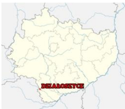
Położenie gminy Działoszyce na tle województwa świętokrzyskiego.

W skład Gminy wchodzi miasto Działoszyce oraz 36 sołectw: Biedrzykowice, Bronocice, Bronów, Chmielów, Dębiany, Dębowiec, Dziekanowice, Działoszyce, Dzierżnia, Galk, Iżykowiec, Jakubowice, Januszowice, Jastrzębniki, Ksawerów, Kujawki, Kwaszyn, Lipówka, Marianów, Niewiatrowice, Opatkowiec, Pierocice, Podrózie, Sancygniów, Stępcice, Sudół, Sypów, Szczotkowice, Szyszczycy, Świerczyna, Teodorów, Wola Knyszyńska, Wolica, Wymysłów, Zagaje Dębiańskie oraz Zagórze.