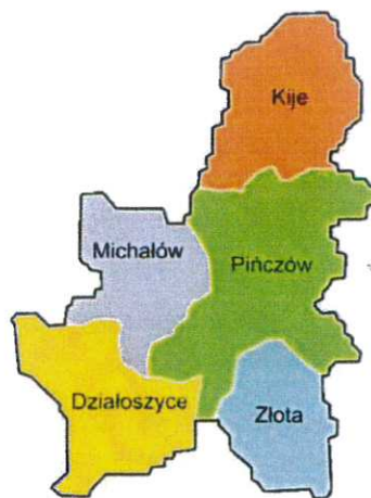
Mapa nr 2: Mapa powiatu pińczowskiego.