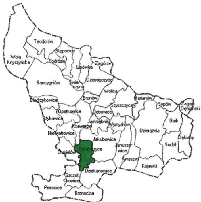
Mapa nr 3: Mapa gminy Działoszyce z podziałem na sołectwa